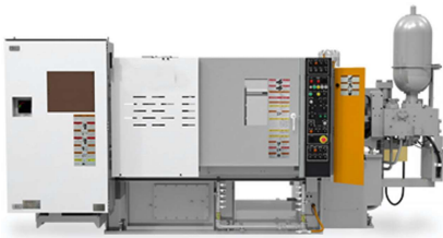
←油圧式アルミダイカストマシン